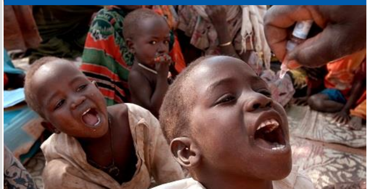
Un jeune enfant recevant la vaccination au Tchad.