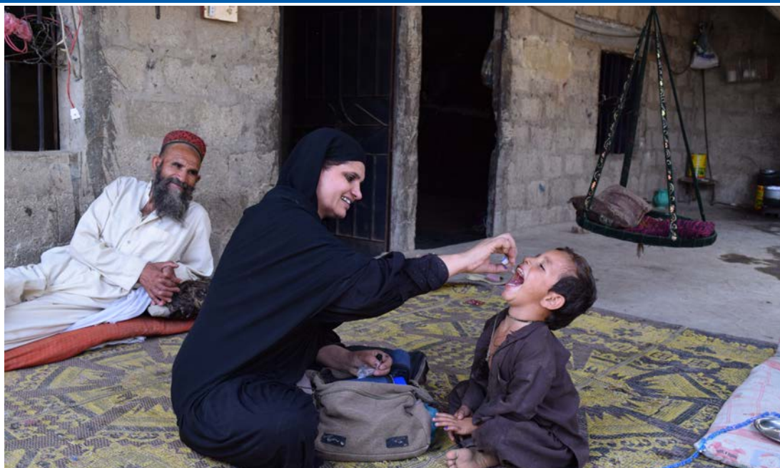
Des vaccinateurs infatigables qui ont gagné la confiance de leurs communautés administrent le vaccin contre la poliomyélite à Karachi, au Pakistan.