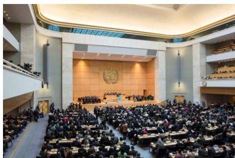
Quelque 3500 délégués venant des 194 États Membres de l'OMS – dont un grand nombre de ministres de la Santé – ont participé à l'Assemblée de la Santé.

Du 23 au 28 mai, les ministres de la Santé du monde entier se sont réunis à Genève pour la Soixante-Neuvième Assemblée mondiale de la Santé. Dans son allocution d'ouverture, le Directeur général de l'OMS, le Dr Margaret Chan, a reconnu les importants progrès réalisés dans la lutte contre la poliomyélite au cours des 28 ans écoulés depuis que le monde s'est engagé pour la première fois à éradiquer la maladie , et elle a remercié tous ceux qui ont participé au succès du remplacement du vaccin antipoliomyélique oral trivalent (VPOt) par le vaccin bivalent en avril. Durant la séance consacrée à la poliomyélite, le point a été fait sur l'épidémiologie mondiale de la poliomyélite, les États membres se sont félicités des progrès obtenus en Afrique et dans les deux derniers pays d'endémie de la maladie, et l'importance du confinement et de la planification de la transition ainsi que la nécessité de combler le déficit de financement ont été soulignés. [En savoir plus]